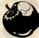
「網絡“智”like男女」 初中生活營