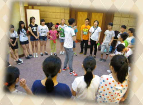
「“智”net任我行」 高小生活營